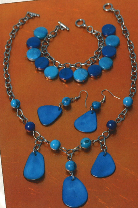
Schmuck-Set aus Tagua-Perlen