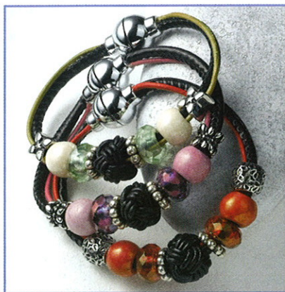
Tolle Armabänder auch in weiteren Farbstellungen.

Auf 30 cm Ziegenlederrundriemen einen Ohrhaken fädeln, den Lederriemen zur Hälfte legen und dann den Ohrhaken mit einem Überhandknoten fixieren. Metall-Radl und Magic Flair Perle auffädeln und mit einem Überhandknoten fixieren, die Enden abschneiden. Den zweiten Ohrhänger ebenso erstellen.